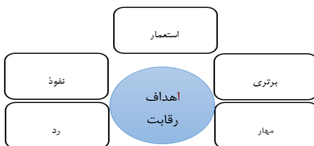
شکل (۱): اهداف رقابت از منظر ژئوپلیتیک

در حال حاضر یا به بروز موازنه‌های صلح پرور منجر شود، مانند رقابت‌های قدرت‌های شرقی و غربی در دوران رقابت‌های ژئوپلیتیک دوقطبی و یا به تعامل و همکاری میان قدرت‌ها بیانجامد، مانند تعامل و همکاری روسیه و بریتانیا در ابتدای قرن بیستم در خصوص روسیه.