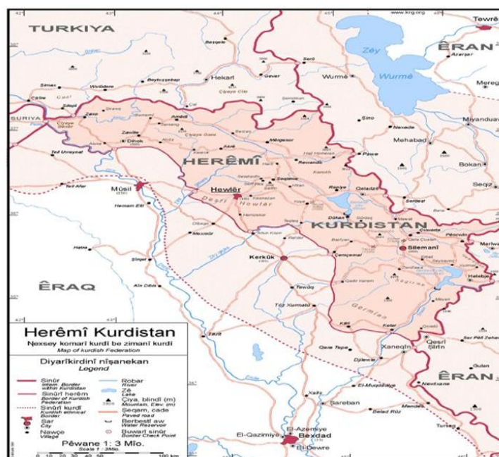
شکل (۳): نقشه موقعیت هیدروپلیتیکی دولت منطقه‌ای کردستان

ترکیه از فقیرترین نقاط این کشور به حساب می‌آید و حتی بعد از سرمایه‌گذاری‌های فراوان دولتی، تنها چهار درصد تولید ناخالص داخلی را تولید می‌کند که فقط دو درصد آن تولید صنعتی است.