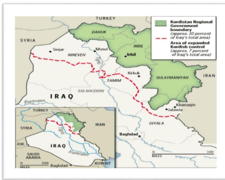
شکل (۱): نقشه دولت منطقه‌ای کردستان و مناطق تحت کنترل