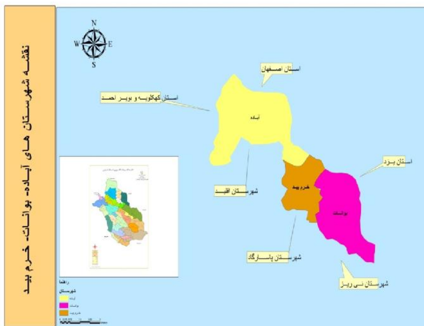
نقشه شماره ۱: شهرستان‌های آباده، بوانات و خرم بید

مطابق قانون تقسیمات کشوری و وظایف فرمانداران و بخشداران مصوب ۱۶ آبان ماه ۱۳۱۶، کشور ایران به ۶ استان و ۵۰ شهرستان تقسیم شد که شهرستان آباده به‌عنوان یکی از شهرستان‌های استان جنوب تشکیل گردید (Ghanbari, 2008: 125). با گذشت زمان شهرستان بوانات در سال ۱۳۷۴ و شهرستان خرم بید در سال ۱۳۷۶ از شهرستان آباده منتزع و به‌عنوان شهرستان‌های جدید استان فارس تشکیل شدند که در بخش به معرفی شهرستان‌های مورد مطالعه پرداخته می‌شود.