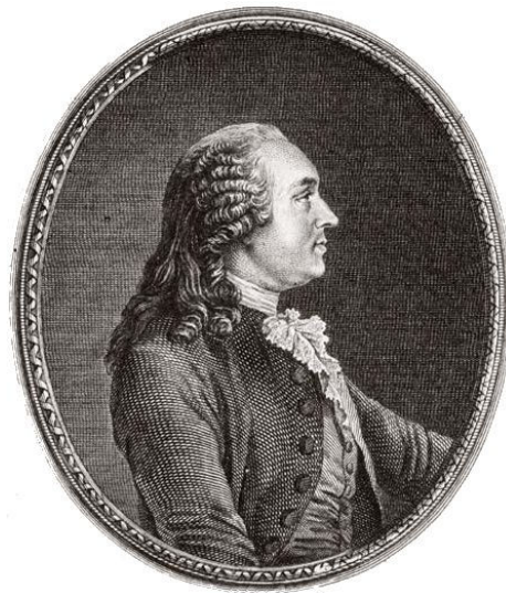
تصویر شماره ۱: آن روبرت ژاک تورگو، بنیانگذار جغرافیای سیاسی در سال ۱۷۵۱م

دولابلاش در جغرافیای انسانی مورد نظر خود، عملاً جغرافیای سیاسی را نادیده گرفت در حالی که به‌طور همزمان، در آلمان فردریش راتزل جغرافیای سیاسی را با موضوع کشور و حکومت تبیین نمود. در واقع جغرافیای انسانی ویدال دولابلاش همان جغرافیای سیاسی تورگو بود که بُعد سیاسی آن توسط دولابلاش مورد غفلت قرار گرفت و تغییر عنوان پیدا کرد (Robic, 2013). البته ویدال دولابلاش، اقدام راتزل برای ایجاد شاخه جغرافیای سیاسی را نیز مورد انتقاد قرار داد (Herb, 2008: 28).