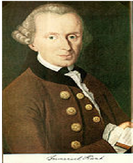
تصویر شماره ۳: ایمانوئل کانت، جغرافیدان و فیلسوف آلمان

ایمانوئل کانت در برنامه تدریس و در آثار خود در نیمه قرن هیجدهم میلادی از اصطلاح جغرافیای سیاسی که در زبان آلمانی پولیتیشه گیوکافی ۱ تلفظ می‌شود استفاده نمود (پولیتشه جئوگرافی). در مورد تاریخ دقیق کاربرد این اصطلاح توسط کانت روایت‌های گوناگونی وجود دارد و دقیقاً مشخص نیست چه زمانی برای اولین بار کانت از آن استفاده کرده است. زیرا کارهای کانت و تدریس‌های او توسط دانشجویانش در سال‌های بعد تنظیم و تدوین شده است. مانند هردر ۲ ، هسه ۳ ، کهلر ۴ و غیره. در این آثار اصطلاح جغرافیای سیاسی و مفهوم آن تا حدی بیان گردیده است. در واقع کانت جغرافیای سیاسی و سایر شاخه‌های جغرافیا را در چارچوب برنامه تدریس خود در زمینه جغرافیای طبیعی بیان کرده است (Stark, 2013: 1). کانت پس از شروع تدریس خود در زمینه جغرافیای طبیعی، در سال ۱۷۵۷ اظهار داشته که از