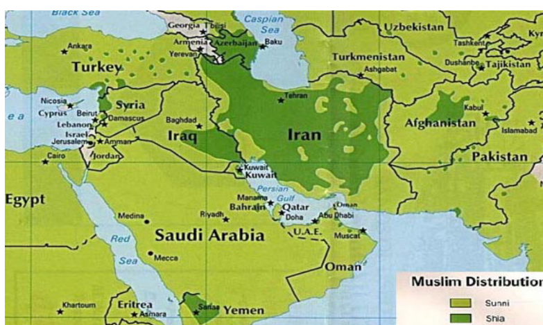
نقشه شماره ۱: جغرافیای شیعه (Nasr, 2006: 25)

می‌شوند. در این میان ایران با اکثریت مطلق ۹۰ درصد شیعه که ۶۸ میلیون نفر از جمعیت این کشور هستند، قلب ژئوپلیتیک شیعه و تنها دولت شیعی قبل از تحولات اخیر در عراق محسوب می‌شد و مرکز اصلی مذهب شیعه و حمایت از شیعیان تحت لوای نظام جمهوری اسلامی ایران به حساب می‌آمد (Ahmadi, 2010: 48).