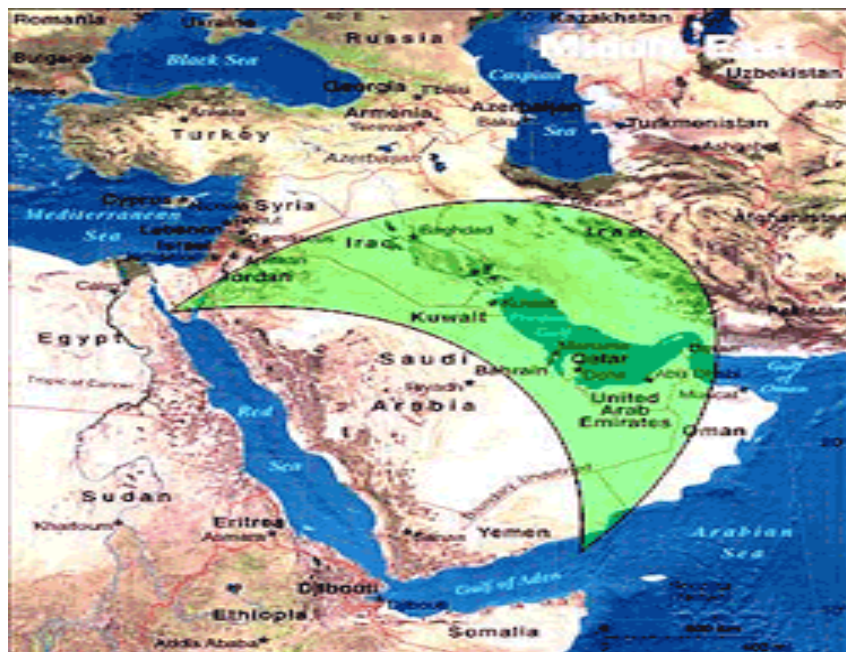
نقشه شماره ۲: تمرکز ژئواستراتژیک شیعیان در خاورمیانه (Thompson, 2009: 23)