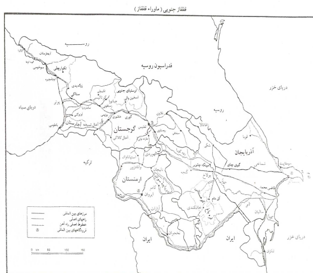
اقتباس از امیر احمدیان، ۱۳۷۶: ۱۲۶