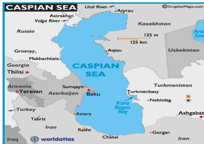
نقشه شماره ۱: نقشه منطقه دریای خزر