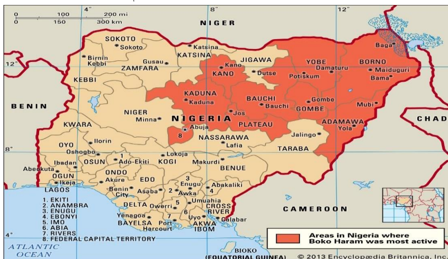
شکل (۴): نقشه ایالت‌های تحت نفوذ بوکوحرام

می‌آموزند. نیجریه ۵ میلیون الماجری دارد که ۸۰ درصد آنان در استان‌های شمالی به سر می‌برند. البته این سازمان اعضای باسواد، ثروتمند و متنغد مانند استادان دانشگاه، پیمانکاران و سیاستمداران نیز دارد که بیشتر تأمین‌کنندگان مالی این سازمان نیز هستند (Onuoha, 2012:3). گروه بوکوحرام در مرحله نخست ورود به میدان، حضور خود را در ایالت‌های بورنو، یوبه، کاتسینا و باوچی افزایش داد و با گذشت زمان تعداد زیادی از پیروان را به خدمت گرفت و ولایت‌هایی را تقریباً در تمام ایالت‌های شمال نیجریه به وجود آورد. در واقع، امارت‌های این گروه از مناطق وسیعی از ایالت بورنو در شمال شرقی نیجریه و برخی از جغرافیای محدود که در کمربندی ایالت یوبه قرار می‌گیرد تشکیل می‌شود (Al-Hawari, 2016:44). شکل (۴) نقشه مناطق تحت واپایش بوکوحرام را نشان می‌دهد: