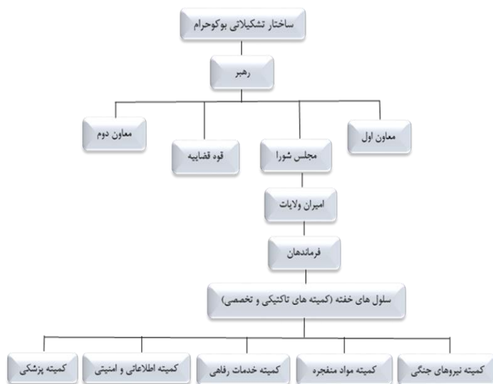
شکل (۱):مدل مفهومی ساختار سازمانی بوکوحرام

ساختار تشکیلاتی بوکوحرام ایجاد کرد (Onawa,2015:1). قوه قضائیه در ساختار تشکیلاتی گروه بوکوحرام نیز حول یک شخص می چرخد و او رهبر معنوی گروه است. وی داور، قانون گذار فقیه و صادر کننده فتوای کشتار غیرمسلمانان و اعلام جنگ علیه مسیحیان است. علاوه بر این، تصویب قانون وادار کردن مردم به گرویدن به دین اسلام با زور و اجبار در کنار وادار کردن زنان و دختران به ازدواج را نیز باید ذکر کرد (Nejat,2019:132). شکل (۱) ساختار سازمانی بوکوحرام را نشان می دهد: