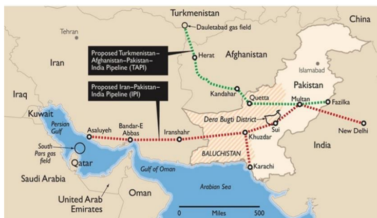
شکل (۲): نقشه طرح خط لوله صلح و تاپی

مهم تأمین‌کننده انرژی هند طرح «خط لوله صلح» ۱ است. این طرح روزانه قابلیت انتقال ۱۵۰ میلیون متر مکعب گاز طبیعی از میداین گازی پارس جنوبی به هند و پاکستان را دارد. در این بین ترکمنستان نیز با طرح خط لوله موسوم به «تاپی» ۲ (شکل ۲)، رقیب جدی ایران و خط لوله صلح جهت فتح کانون بزرگ مصرف انرژی شبه‌قاره محسوب می‌شود (Koolaee and Imani Kalesar, 2017:131).