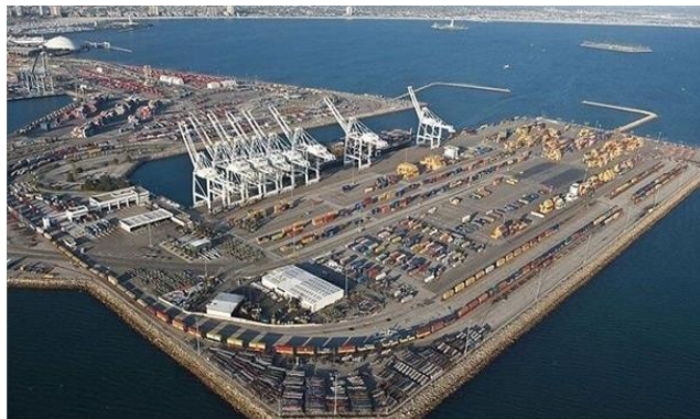
شکل (۲): اسکله‌های بندر شهید بهشتی چابهار