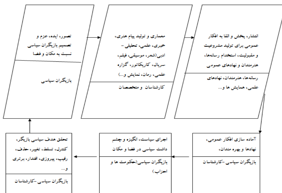
شکل شماره ۱: فرایند تصویرسازی ژئوپلیتیک از مکان و فضای جغرافیایی