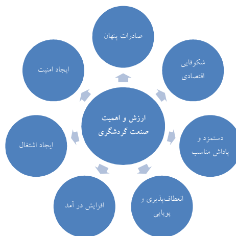
نمودار شماره ۱: ارزش و اهمیت صنعت گردشگری

«گردشگری شامل فعالیت‌های اشخاص مسافر برای اقامت در مکان‌هایی خارج از محیط همیشگی زندگی خود برای حداقل ۲۴ ساعت یا کمتر از یکسال متوالی به منظور فراغت، تفریح و... بدون کسب درآمد اقتصادی و یا اشتغال است» (Doswell, 2005: 19). این مفهوم شامل مسافرت‌های داخل کشور و حتی سفرهای روزانه نیز می‌شود. گردشگری مدرن یک رشته علمی است که اخیراً توجه محققین رشته‌های مختلف را به خود جلب کرده است.