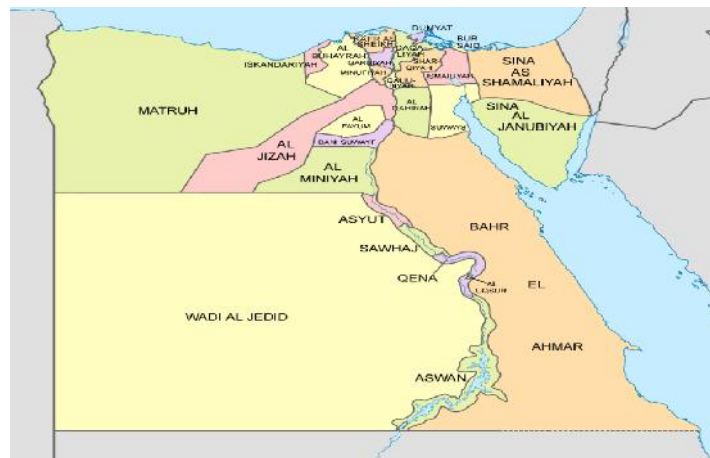
نقشه شماره ۴: تقسیمات سیاسی مصر