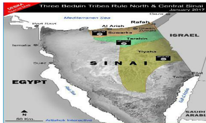
نقشه شماره ۳: موقعیت داعش در صحرای سینا