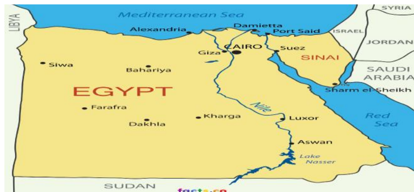
نقشه شماره ۱: موقعیت جغرافیایی کشور مصر