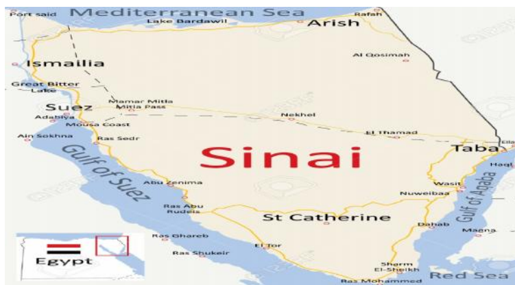
نقشه شماره ۲: موقعیت راهبردی صحرای سینا

آن زمينه‌هاي واگرایی در سطحی بسيار بالا وجود دارد. زیرا آن تنها قطعه سرزمینی مصر است که آن را خليج و کانال سوئز از سرزمین اصلی مصر جدا انداخته است، این جدایی سرزمینی؛ بویژه زمانی که دولت مرکزی ضعیف باشد و نتواند کارویژه خود را به درستی انجام دهد و یا اینکه بخواهد در برنامه‌ریزی‌ها و سیاست‌گذاری‌های خود به گونه‌ای تبعیض‌آمیز عمل کند؛ ممکن است ساکنان این شبه جزیره را به تلاش برای جدایی‌طلبی و یا حداقل خودمختاری ترغیب نماید ( http://sis.gov.eg/year2003/html land.htm ).