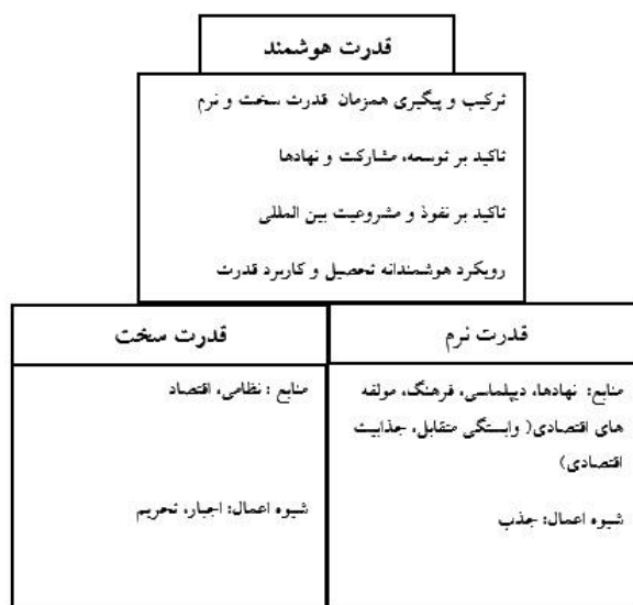
شکل شماره ۱: قدرت هوشمند و منابع آن