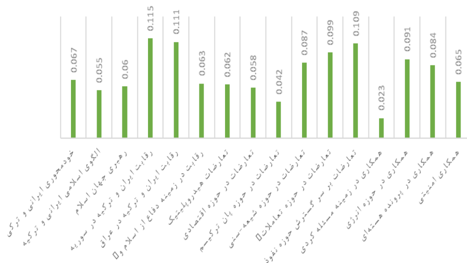
وزن عوامل موثر بر روابط ایران و ترکیه