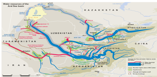
شکل (۲): نقشه موقعیت سیردریا و آمودریا در آسیای مرکزی و حوضه آبریز آن‌ها