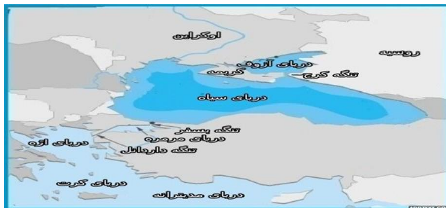
شکل (۴): موقعیت راهبردی کریمه، دریای سیاه، دریای آزوف و تنگه‌های کرچ، بسفر و داردانل

اروپا و از دست دادن این شبه جزیره، ضمن تضعیف موقعیت ژئوپلیتیکی روسیه، ضربه‌ای مهلک به استراتژی دریایی و در کل توان نظامی روسیه نیز وارد می‌شد.