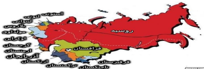
شکل (۲): پانزده جمهوری اتحاد جماهیر شوروی سابق

خارج نزدیک به منطقه‌ای گفته می‌شود که چهارده جمهوری تازه تأسیس عضو اتحاد جماهیر شوروی سابق در آن حضور دارند که شامل چهار منطقه قفقاز جنوبی، آسیای مرکزی، بالتیک ۱ و غرب روسیه می‌شود. این مناطق در ادبیات سیاسی روسیه، اعم از اسناد رسمی، بیانات رهبران و رسانه‌ها با عناوینی مانند «خارج نزدیک» و «حوزه منافع ویژه و حیاتی» یاد می‌شود (Herd, 2005:223).