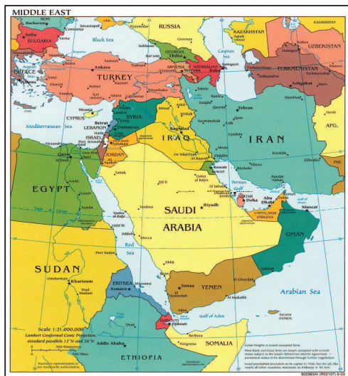
نقشه شماره ۱: موقعیت ایران در خاورمیانه

از سویی دیگر ایران با توجه به موقعیت ترانزیتی خود که ناشی از برتری‌های ژئوپلیتکی، یعنی قرارگیری در چهارراه بین‌المللی، حائز اهمیت است. این چهار راه آفریقا را به آسیا و آسیا را به اروپا متصل می‌کند.