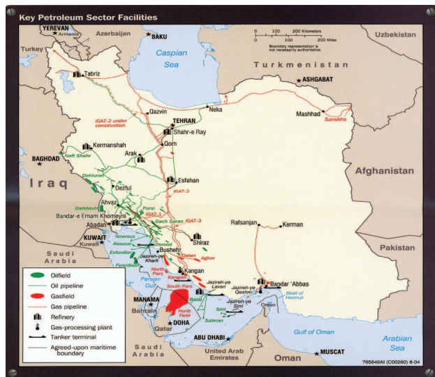
نقشه شماره ۲: منابع نفت و گاز و خطوط انتقال آنها

توسعه مشارکتهای خود در انرژی با کشورهای دیگر دارد که ایران یکی از این کشورهاست. ایران در حال حاضر مرکز ثقل مهمی در ساختار امنیت انرژی چین محسوب می‌شود و در ابتدای سال ۲۰۰۵ در رتبه سوم کشورهای صادرکننده نفت به چین بوده. ایران در ابتدا تنها ۱۴٪ از نیازهای وارداتی نفت چین را تأمین می‌کرد اما بعد از امضای یکسری توافقنامه‌هایی در سالهای ۲۰۰۵ و ۲۰۰۶ میلادی، به یکی از بزرگترین صادرکنندگان نفت به چین مبدل شد (مادسن، ۲۰۰۷/۶/۱۲).